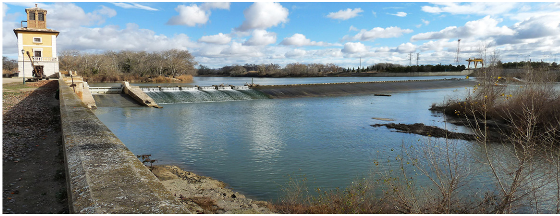
Presa del Bocal

Se ofrece la posibilidad de contratar una experiencia 4x4 con un recorrido por las Bardenas para todos los públicos. Se deberá especificar en la reserva.