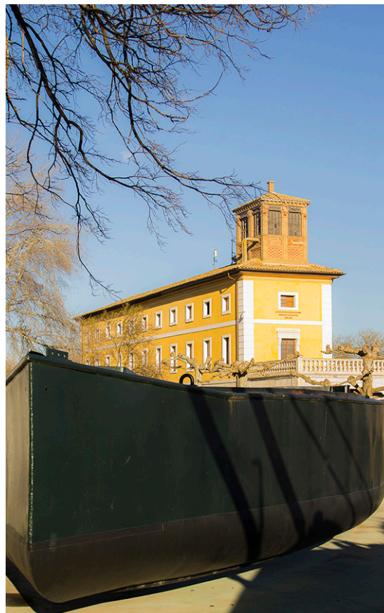
Exposición de barcas restauradas en El Bocal

Alojamiento en Hostel La Parrilla de Tudela.