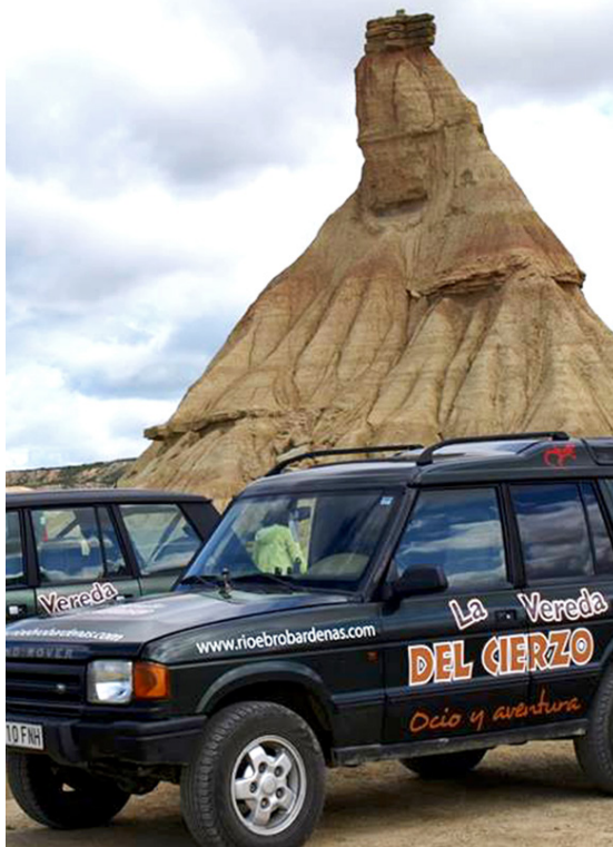
Experiencia 4x4 en Las Bardenas Reales

Paseo por el entorno, visita guiada con contenido adaptado para todos los públicos y despedida.