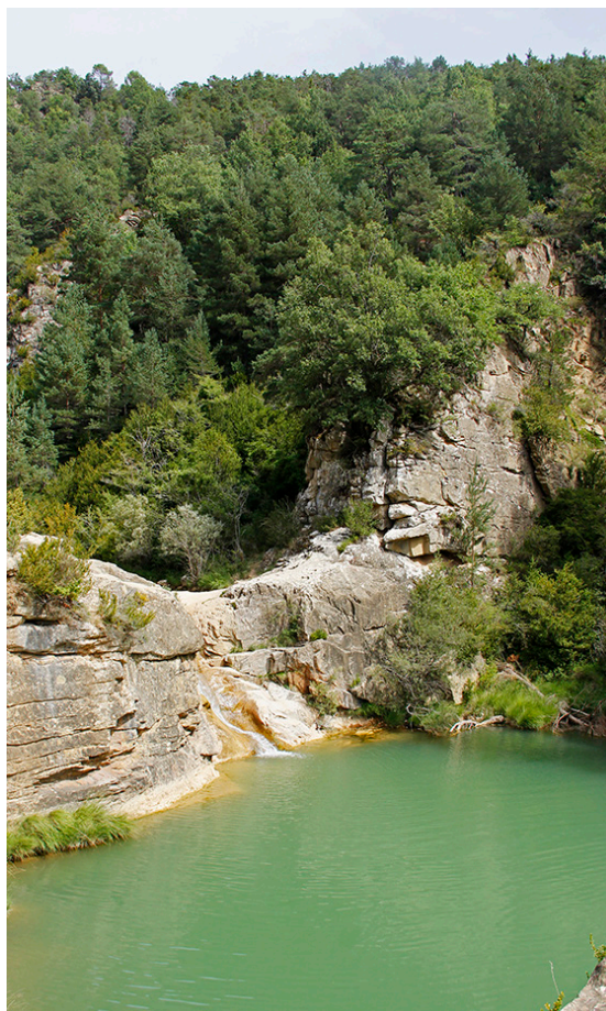
Pozo Pígallo en Luesia