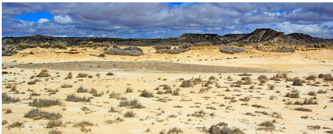
Bardenas Reales de Navarra

** Se recomienda llevar vestimenta adecuada para la actividad de trekking: botas cómodas o deportivas, gorra, protector solar, chubasquero y agua. ¡no olvides la cámara de fotos!